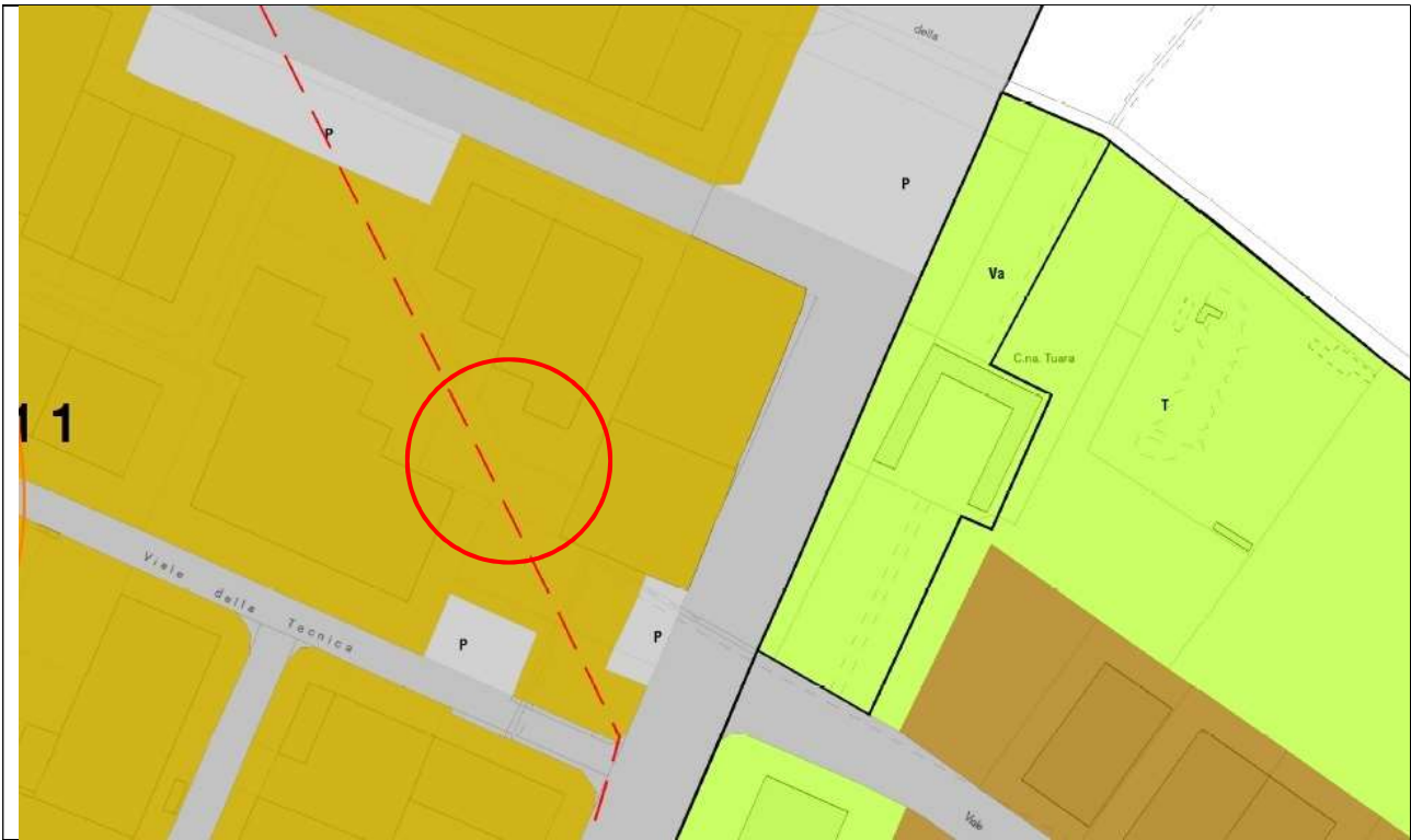
Stralcio di P.R.G.C. – TAV 7.1 - SCALA 1:2000